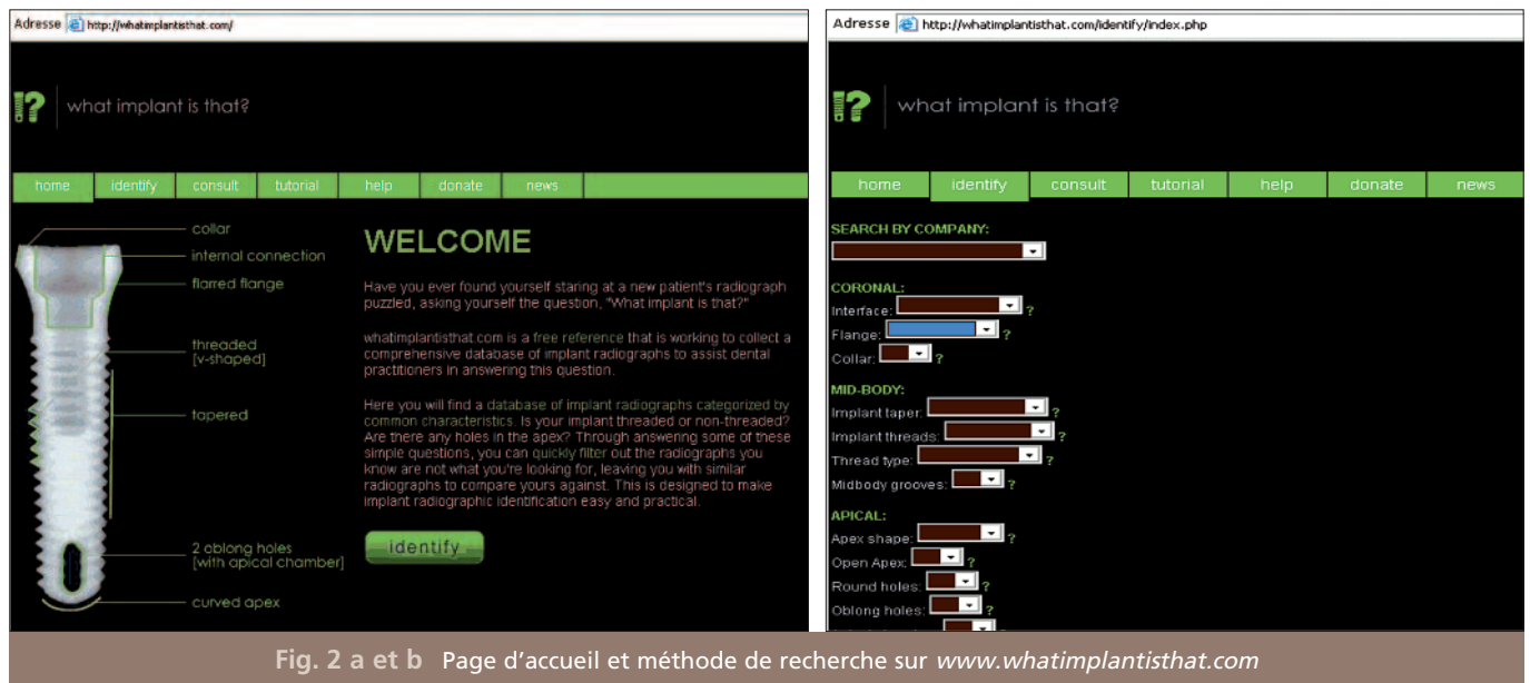
Fig. 2 a et b Page d'accueil et méthode de recherche sur www.whatimplantisthat.com

Cette étude et recherche peut sembler également difficile pour quelqu'un non habitué aux implants dentaires ou qui n'aurait pas réussi à identifier seul l'implant en question sur le site. Autre cas de figure, le demandeur n'aurait pas le temps de réaliser cette recherche : dans ce cas, un autre volet existe sur ce site afin de demander à des intervenants de retrouver le type d'implant que l'on cherche. Cette démarche est alors payante (75 dollars par recherche en 2011). Dans ce cas, il faut envoyer