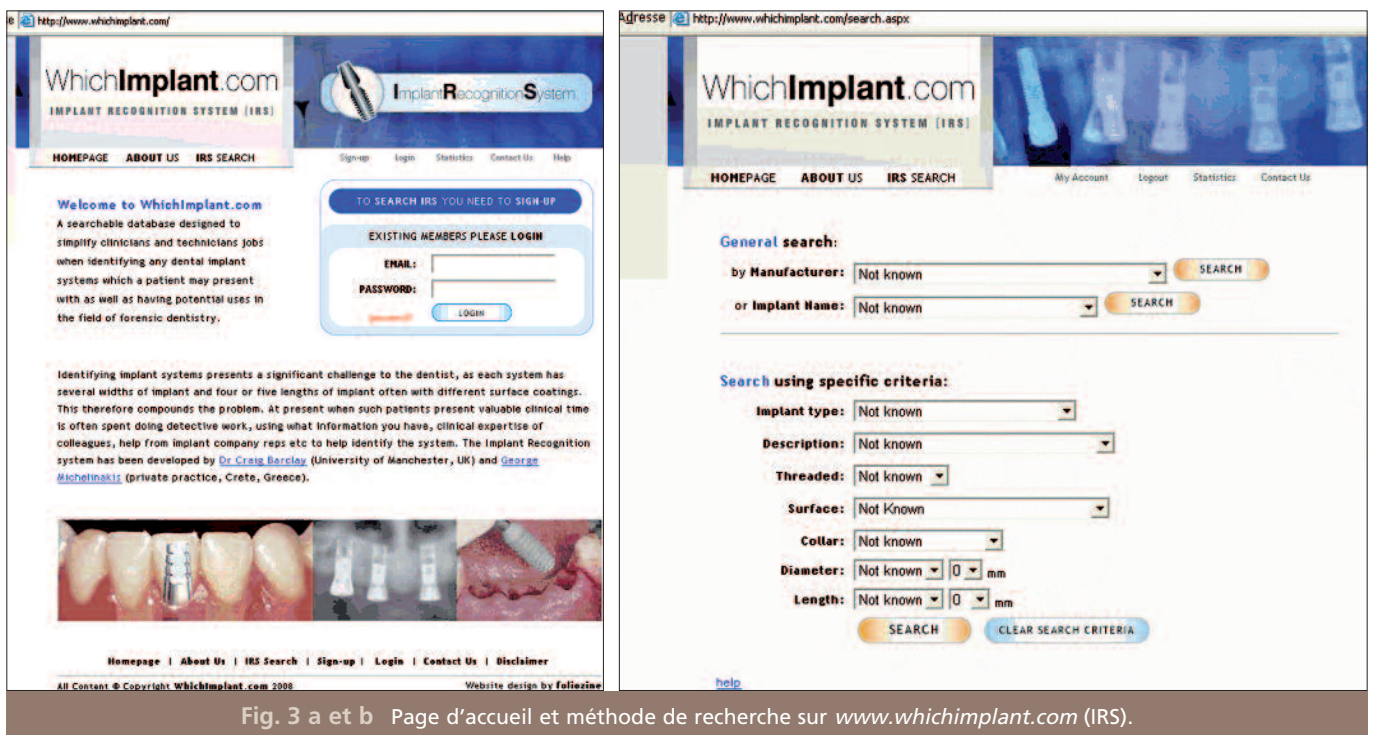
Fig. 3 a et b Page d'accueil et méthode de recherche sur www.whichimplant.com (IRS).